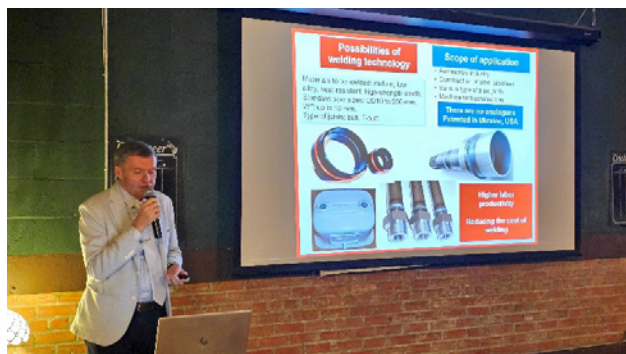
Презентація розробок ІЕЗ для ASM International, Х'юстон, США

На виставці FabTech-2024 понад 1500 компаній з 35000 експонентами продемонстрували свої продукти та послуги на площі 750000 квадратних