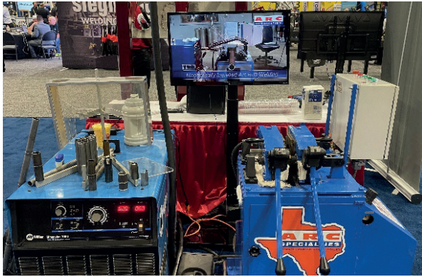
Зварювальний апарат ПЗМД був представлений Володимиром Качинським на виставці FABTECH 2024 в Орландо з демонстрацією процесу живого зварювання