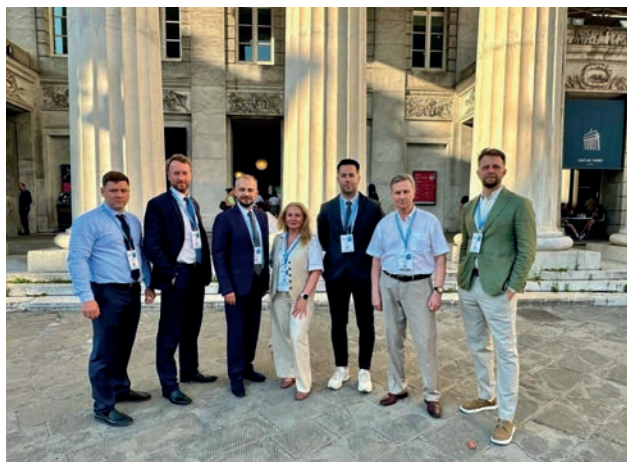
Учасники Асамблеї від ІЕЗ

Представники ІЕЗ взяли участь у роботі технічних комісій Асамблеї, що охоплюють