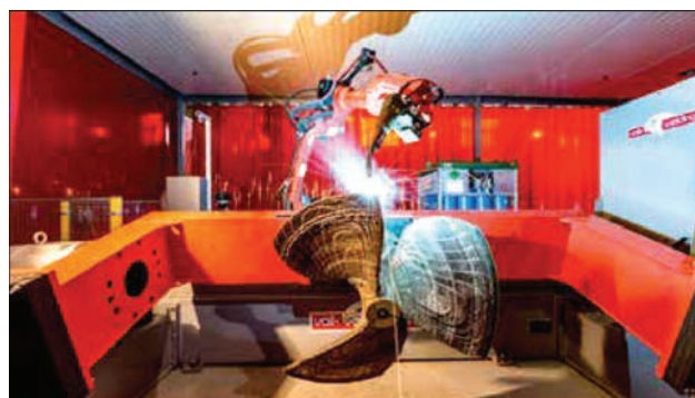
Рис. 5. Бронзовый винт (1300 мм, 180 кг)

Ограничения процесса. Многие сплавы могут быть использованы во время процесса WAAM. Однако некоторые материалы гораздо более склонны к взаимодействию с остаточным кислородом и это может привести к поверхностному окислению. Титановые сплавы особенно чувствительны, но нержавеющая сталь и многие низколегированные стали также требуют дополнительной защиты инертным газом.