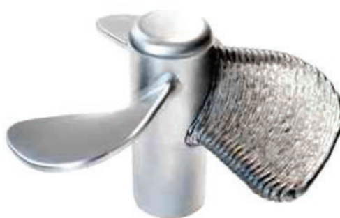
Рис. 2. Винт размерами 200×240×240 мм (материал: 1.5125 G3Si1)