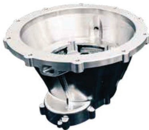
Рис. 3. Корпус колокола размерами 230×380×380 мм (материал — алюминиевый сплав)

«проволока + дуга» для изучения возможности использования в качестве конструкционных материалов инконеля, титана, алюминия и различных никелевых сплавов. С тех пор акцент сместился на изготовление планеров. Хотя метод «лазер + порошок» активно применяется для быстрого прототипирования или получения очень небольших и сложных деталей, эта технология имеет ограничения из-за своей низкой скорости и размеров компонентов, которые нужно точно изготовить. Напротив, процессы, разрабатываемые в университете Крэнфилд, рассчитаны на высокие скорости осаждения. Центр Крэнфилда в настоящее время нацелен на уровень осаждения 10 кг/ч, по сравнению с обычным 0,1 кг/ч, используя «лазер + порошок», при котором может быть риск того, что материал не будет полностью уплотнен, если не произошло спекание между частицами порошка.