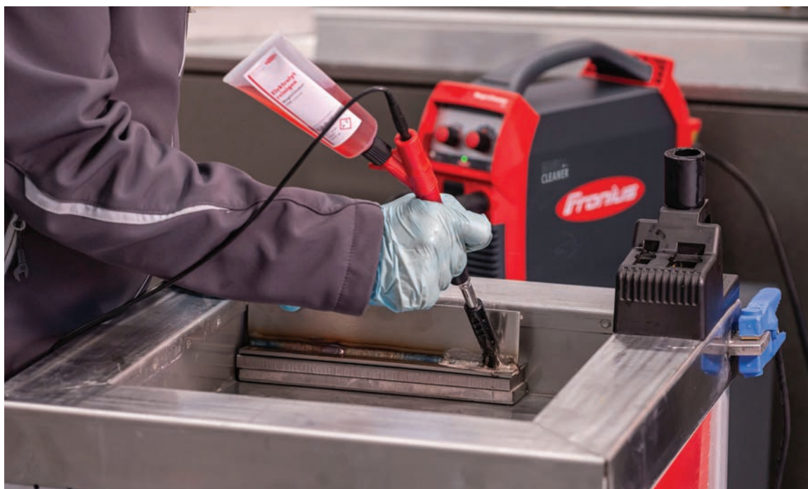
MagicCleaner 150 — легка підготовка до роботи та простота використання

регулювати споживання електроліту. Це сприяє економії ресурсів і дає змогу досягти екологічності виробництва. За допомогою MagicCleaner розчин електроліту доставляється саме туди, куди потрібно. Фетр для очистки та полірування, щітки, що входять у комплект, проникають у кути та щілини, забезпечуючи оптимальне очищення з мінімальним використанням матеріалів. Електрохімічне очищення значно економніше, ніж звичайне травлення в хімічних ваннах, і не руйнує матеріал, як піскоструменева обробка. Розробники подбали, аби користувачі могли легко та швидко ввести обладнання в експлуатацію, й реалізували інтуїтивно зрозумілу концепцію керування. Завдяки цьому усі важливі параметри (режим роботи, характеристики очищення та показники споживання електроліту) можна переглянути та налаштувати на передній панелі пристрою. Пристрої вирізняються легкістю й енергоефективністю, оскільки втілили в собі новітню інверторну технологію. Ця технологія забезпечує вихідну потужність на рівні пристроїв попереднього покоління за меншого споживання електроенергії.