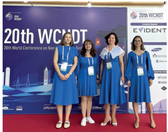
OKOndt GROUP була представлена жіночим складом фахівців