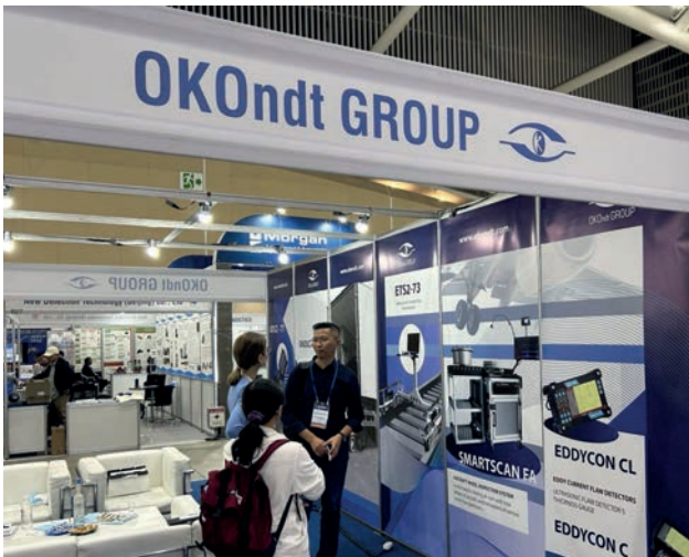
Стенд OKOndt GROUP