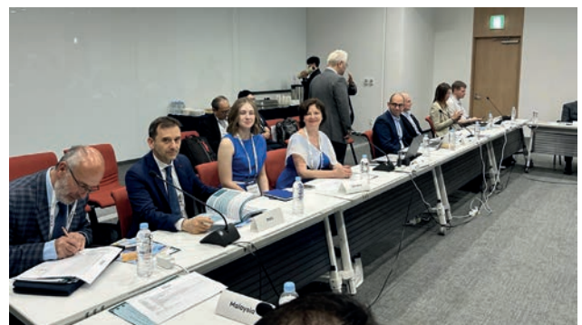
На Генеральній асамблеї Міжнародного комітету з НК