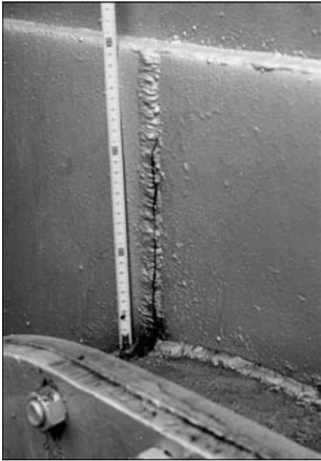
Рис. 2. Развитие трещины в кольцевом шве, выполненном на усиливающей накладке овального люка, в резервуаре для хранения нефти из стали 09Г2С-12 вместимостью 20 тыс. м 3 с толщиной стенки 16 мм

ливающей накладки к стенке толщиной 16 мм овального люка резервуара для хранения нефти из стали 09Г2С-12 РВС ПК вместимостью 20 тыс. м 3 . Зарождению и развитию трещины в значительной мере способствует наличие на вертикальной оси укрупнительного стыкового шва накладки. На рис. 3 представлен еще один случай разрушения кольцевого шва, выполненного при вваривании патрубка Ду 300 в стенку резервуара РВС ПК из стали типа С390 вместимостью 50 тыс. м 3 с толщиной стенки 26 мм. При гидравлическом испытании через контрольное отверстие в накладке появилась течь воды. После полного спуска воды был выполнен цветной контроль кольцевого шва внутри емкости, который выявил наличие сквозных кольцевых и поперечных трещин преимущественно в нижней части шва (рис. 3). Помимо недостатков технологии сварки, существует еще ряд отрицательных факторов, которые приводят к зарождению и развитию трещин — это трудности получения полного проплавления стенки по ее толщине и особенно в корне шва.