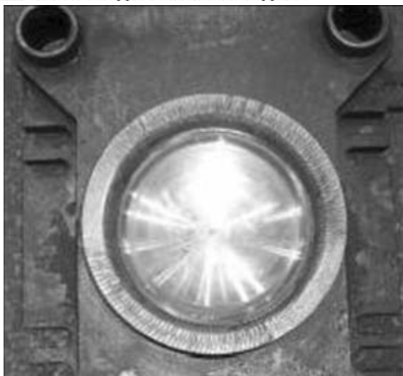
Рис. 1. Матрица для вырубki доньшка ресивера после плазменной закалки