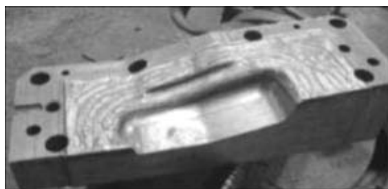
Рис. 4. Фрагмент разрезного штампа после плазменной закалки

Многие крупные штампы имеют длительный цикл изготовления с разрезанием на относительно