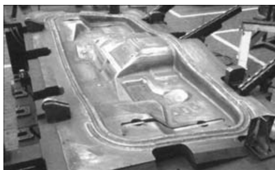
Рис. 5. Матрица автомобиля ГАЗ после плазменной закалки прижимного контура

небольшие части для объемной закалки в печах и последующей трудоемкой подгонкой закаленных фрагментов в единое целое. На Волжском автозаводе провели эксперимент, заменив объемную закалку поверхностной плазменной закалкой (рис. 4), что позволило избежать подгонки закаленных частей (около 30 % общей трудоемкости изготовления штампа), поскольку их выполнили как единое целое по чертежным размерам. Штамп, на котором изготовлено более 70 тыс. изделий (задняя балка крыши автомобиля), находится в работоспособном состоянии. При этом трудоемкость ремонтных «зачисток» за счет сокращения их частоты и продолжительности уменьшилась примерно в 10 раз.