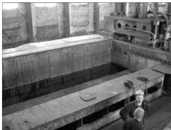
Рис. 9. Бункер пресс-ножниц, футерованный листами после упрочнения плазменной закалкой