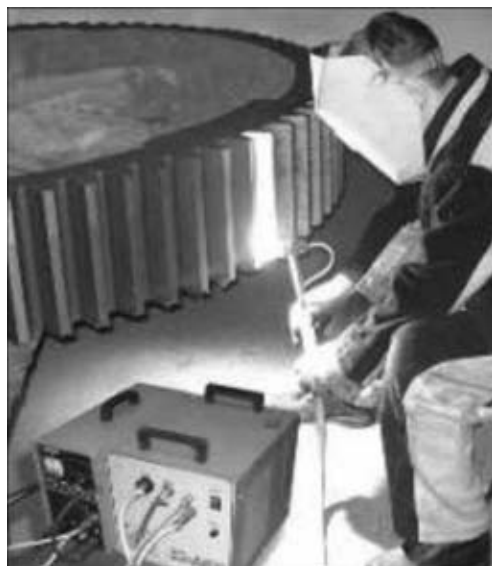
Рис. 7. Плазменная закалка зубьев крупномодульной шестерни

На том же заводе выполняли плазменную закалку крановых рельсов тяжелого типа КР-100. При одинаковом сроке эксплуатации износ закаленных рельсов составил около 0,2 мм, незакаленных — около 2 мм.