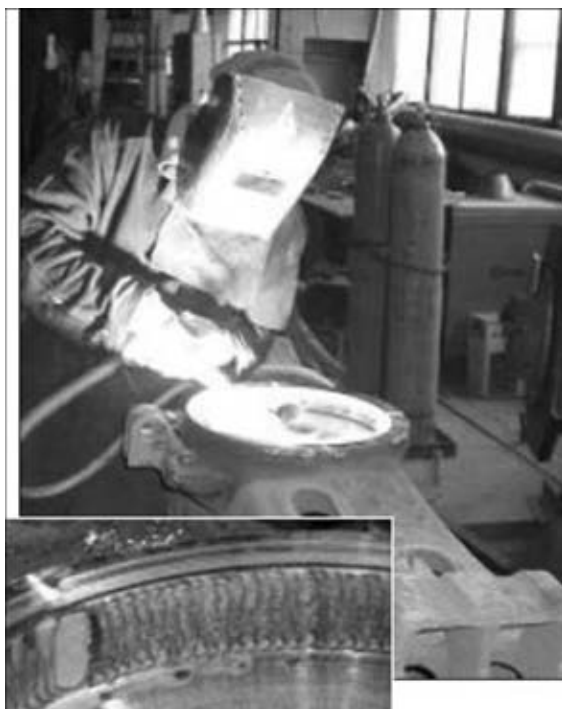
Рис. 8. Плазменная закалка бурта подпятника вагона и фрагмент закаленной поверхности

На этом же предприятии имеется опыт плазменной закалки транспортирующих рельсов на линии по производству осей железнодорожных колесных пар. После изготовления 200 тыс. осей эти рельсы изнашивались по высоте на 3,2 мм. Аналогичные рельсы после плазменной закалки изнашивались всего лишь на 0,5 мм при объеме производства 320 тыс. осей. Таким образом, в результате плазменной закалки износостойкость рельсов повысилась более чем в 6 раз. В настоящее время на Уралвагонзаводе проводятся мероприятия по внедрению плазменной закалки в