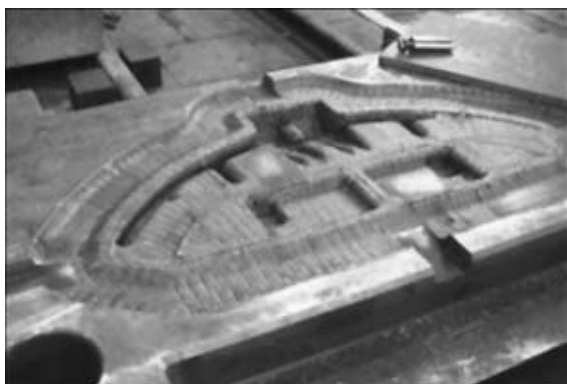
Рис. 3. Штамп сложной формы после плазменной закалки (ООО «КУМЗ»)

добному шагу в порядке эксперимента прибегли на Каменск-Уральском металлургическом заводе (рис. 3).