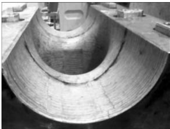
Рис. 6. Матрица для формовки трубных тройников большого диаметра после плазменной закалки

и шлицы на валах-шестернях; приводные шестерни железнодорожных локомотивов и др. В результате плазменной обработки срок службы зацеплений увеличивается в 2...3 раза.