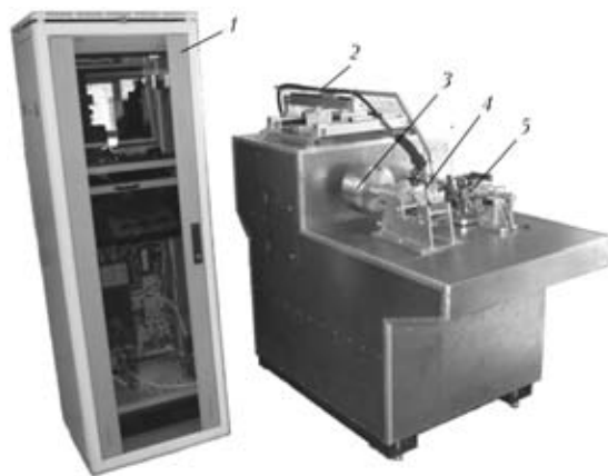
Рис. 2. Общий вид машины (МИС) для испытания на ГТ по стандарту РФ: 1 — блок управления параметрами испытания, их визуализации и регистрации; 2 — манипулятор сварочной головки для ее перемещения по x , y и x_y ; 3 — силоизмеритель; 4 — устройство для сварки образцов и их испытания на изгиб или растяжение; 5 — устройство для имитации сварочного цикла в образцах и испытания на ГТ в стадии охлаждения

Кроме того, в результате локального нагрева образца дугой и снижения сопротивления металла деформированию неизбежна локальная концентрация деформаций под дугой, причем больше машинной v_{\text{м}} , степень ее зависит от теплофизических свойств сравниваемых сталей или сплавов, а длительность деформации может быть меньше времени ТИХ.