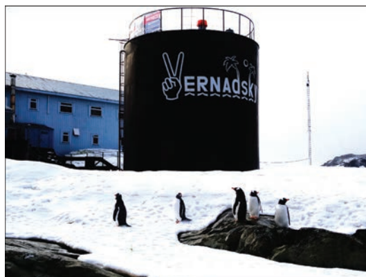
Рис. 1. Общий вид резервуара РВС-200 на антарктической станции «Академик Вернадский»

на станции «Академик Вернадский». Конструкция емкости проста и принятая простота гарантирует ее полную безопасность при отсутствии ремонтов в течение более 50 лет. Из стальных балок на болтовых соединениях смонтирована пространственная система с вертикальными и горизонтальными стойками и ригелями, обшитая изнутри листами толщиной 6 мм из нержавеющей стали аустенитного класса. Листы крепятся к каркасу болтами через герметизирующие прокладки. В стенке и крыше имеются технологические патрубки и люки для заправки и забора топлива и осмотра его конструкции. Отметим, что на время проектиро-