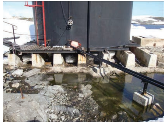
Рис. 2. Общий вид устройства основания резервуара РВС-200 «ОКТЬ ИЭС им. Е. О. Патона НАНУ», на договорной основе с Национальным антарктическим научным центром Украины, выполнено в январе-марте 2016 г. полное техническое диагностирование рассматриваемого резервуара РВС-200.

После 10 лет эксплуатации, в соответствии с действующим стандартом Украины [2], ГП