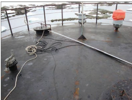
Рис. 4. Общий вид крыши резервуара РВС-200

Коррозионные повреждения резервуара. При общем технически удовлетворительном состоянии металлоконструкций рассматриваемого резервуара (статическая прочность и устойчивость), надежность резервуара определяется величиной коррозионных повреждений основных несущих