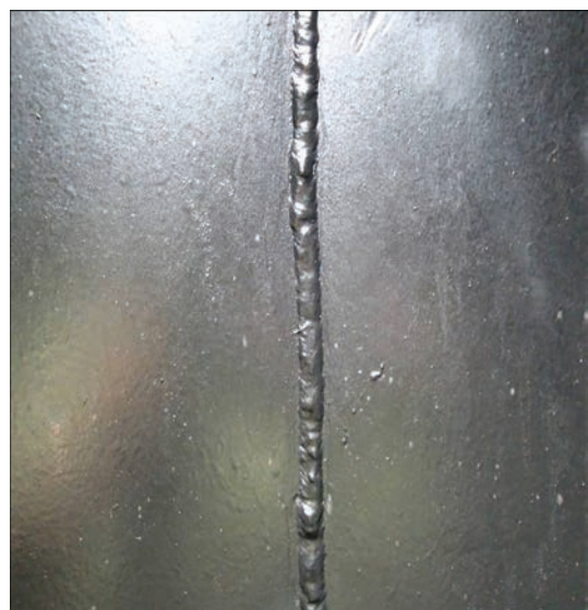
Рис. 3. Общий вид вертикальных сварных швов на внутренней поверхности стенки основного резервуара

Фундамент резервуара. Резервуар построен на монолитном скалистом основании, что представляет собой характерную поверхность острова Галиндез. Основание резервуара выполнено в виде двухъярусной системы балок (рис. 2). Ниж-