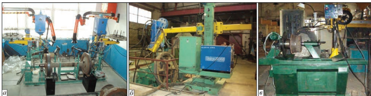
Рис. 1. Установки для наплавки и восстановления деталей: РМ-09 (а); РМ-15 (б); ИЗРМ-05 (в)

Рациональность применения в системах манипуляторов, вращателей, передвижных колонн, новых разработок сварочно-наплавочного оборудования обусловлена, в том числе, и возможностью