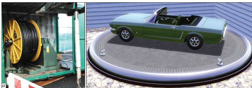
Рис. 5. Некоторые другие варианты применения МСО: разматыватель для погружения и поднятия сварочного автомата (а), демонстрационный вращающийся подиум (б)

деля и подшипниковых узлов стола. А балансирный вращатель имеет возможность перемещаться по рельсовому пути и, в зависимости от диаметра изделий, изменять расстояние между роликкооперами.