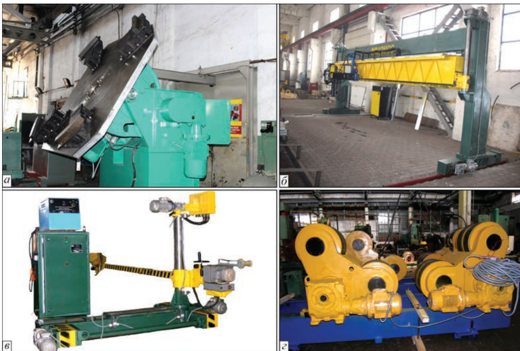
Рис. 4. Уникальные образцы МСО: универсальный манипулятор грузоподъемностью 7000 кг (а), передвижной портал (б), установка для полуавтоматической сварки под флюсом кольцевых и продольных внутренних швов (в), балансирный вращатель грузоподъемностью 40000 кг (г)

Особенности манипулятора — увеличенные габаритные характеристики планшайбы (диаметр 1,4 м) и наличие водяного охлаждения шпин-