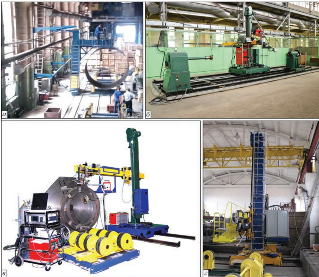
Рис. 3. Комплексы автоматизации и механизации сварочных процессов с использованием специального МСО

совому пути со сварочной скоростью. Также, для осуществления механизации сварки и родственных процессов, были разработаны и изготовлены универсальный манипулятор грузоподъемностью 7000 кг (рис. 4, а) и балансирный вращатель гру-