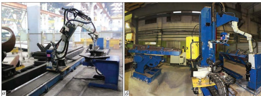
Рис. 2. Роботизированные комплексы с применением универсального манипулятора (а), универсального и двухстоечного горизонтального манипулятора (б)

этого оборудования поддерживать заданные параметры рабочего движения даже в протяженных циклах, с высокой степенью точности осуществлять позиционирование рабочего инструмента. В качестве примера можно отметить, что передвижные сварочные колонны могут выполнять высокопроизводительную сварку протяженных изделий типа настилов с возможностью высокоточного сканирования рельефа свариваемых поверхностей, что обеспечивается применением современных компьютеризованных электроприводов и датчиков расстояния до свариваемой поверхности.