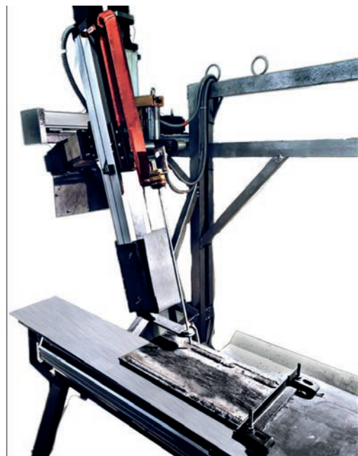
Рис. 1. Зовнішній вигляд маніпулятора

Маніпулятор забезпечує в автоматичному режимі характерні для зварника переміщення зварювального інструмента поперек та уздовж шва і подачу електрода при зварюванні покритим електродом. При цьому функція динамічного регулювання швидкості його подачі із зворотним зв'язком стабілізує напругу дуги, що з високою точністю фіксує її довжину. В комплексі також передбачена цифрова фіксація параметрів і відеофіксація процесу зварювання. Крім того, комплекс підключено до центрального серверу підприємства, що дозволяє в онлайн режимі контролювати якість виготовлення електродів. Вся отримана інформація архівується, що дає можливість мати банк даних для подальшого статистичного аналізу з метою визначення оптимальних шляхів вдосконалення електродного виробництва.