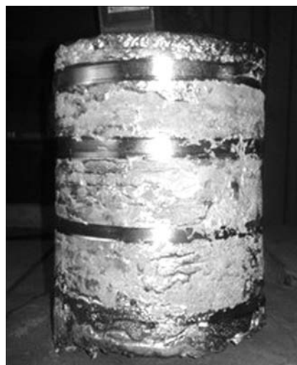
Рис. 2. Слиток интерметаллида TiAl после двойного переплава

Опытные плавки слитков диаметром 165 мм интерметаллида TiAl проводили на установке УЭ-208М. Переплавливали шихту титанового сплава ВТ1-0, технически чистого алюминия, электролитического хрома, ниобия и циркония. Гексаборид лантана вводили в шихту в виде цилиндрических прессовок, полученных прессованием порошка LaB 6 в специальной пресс-форме. Готовые прессовки гексаборида лантана помещали между тугоплавкими компонентами шихты с тем, чтобы избежать прямого воздействия на них электронно-лучевого нагрева и возможности испарения. При подготовке шихты легирующие элементы с высокой упругостью пара (хром и алюминий) шихтовали с учетом потерь на испарение.