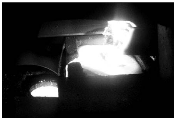
Рис. 1. Процесс плавки интерметаллида TiAl

При электронно-лучевой плавке затруднительно вводить бор в выплавляемый интерметаллид TiAl, поскольку под воздействием электронно-лучевого нагрева при расплавлении бора, имеющего высокую упругость пара при плавлении, происходит его сильное испарение, а также распыление и унос частиц при его введении в шихту виде порошка. Поэтому для этой цели применили гексаборид лантана LaB 6 , имеющий значительно меньшую упругость пара при плавлении, чем бор, и уменьшающий его испарение.