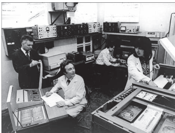
Рис. 1. Лаборатория технической диагностики в 1979 г.

Цель – разработка теории, методов и средств обеспечения безопасности эксплуатации конструкций и сооружений.