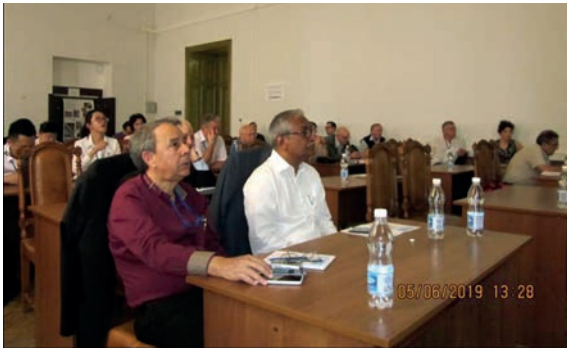
Засідання секції неруйнівного контролю