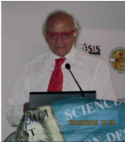
Виступає президент Міжнародної академії НК Джузеппе Нардоні (Італія)

laser shearography method» (L. Lobanov, V. Savitsky, Paton Electric Welding Institute of NASU). В ній показано переваги оптичних методів (голографії, оптичної інтерферометрії, спекл-інтерферометрії та цифрової кореляції зображень) для вирішення даної проблеми порівняно із стандартним методом, який передбачає свердлення отворів і використання засобів тензометрії. Серед оптичних методів на думку авторів найбільш перспективним є метод лазерної широгографії, який на відміну від голографічного та спекл-інтерферометричного методів не вимагає спеціальної віброізоляції. Проведені експерименти та результати моделювання показали, що поєднання лазерної широгографії з методом отворів дозволяє визначати залишкові напруження у виробничих умовах з високою точністю.