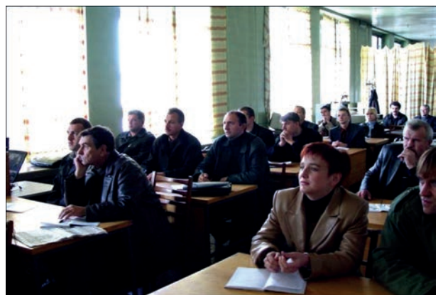
Рис. 5. Подготовка специалистов по технической диагностике

1. Аналитически показано, что в твердых телах распространяются волны со скоростями выше C_1 \approx 0,5 см/мкс для сталей. Поэтому скорости C_1 , C_2 и C_3 (скорость волны Рэлея) могут быть приняты в расчетах за базовые физические постоянные. Скорости выше C_1 опытным путем не зафиксированы в связи с тем, что существующие АЭ датчи-