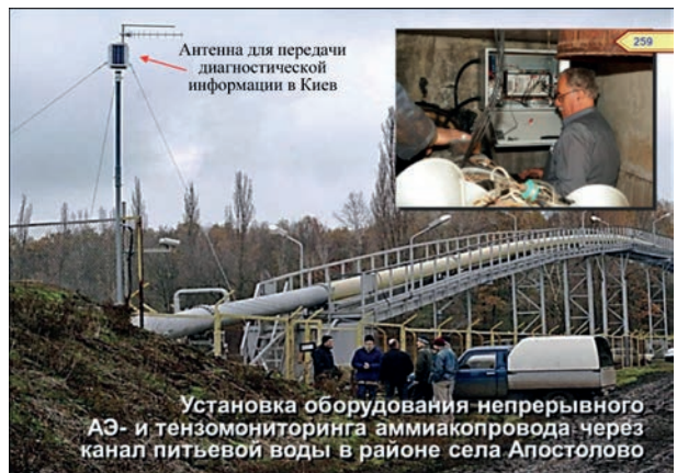
Рис. 4. АЭ- и тензоконтроль аммиакопровода у села Апостолово с передачей информации в центральный диагностический центр в г. Киеве