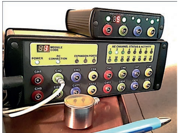
Рис. 3. Приборы ЕМА-4 (4-х и 16-ти каналные)