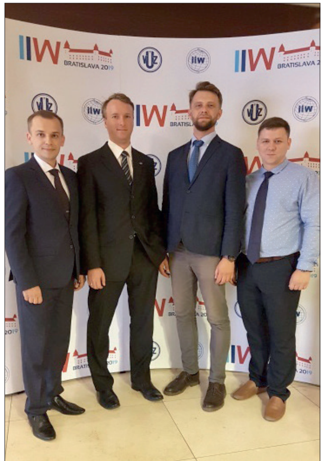
Делегація на МІЗ від ІЕЗ ім. Є.О. Патона

Вже багато років поспіль ІЕЗ ім. Є.О. Патона вручає одну з найпочесніших нагород цього міжнародного форуму – Приз Євгена Патона. Цей рік, як і завжди, спільноті в галузі електрозварювання було висунуто багато претендентів. Виборів же